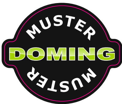
Beispiel druckfertige Datei